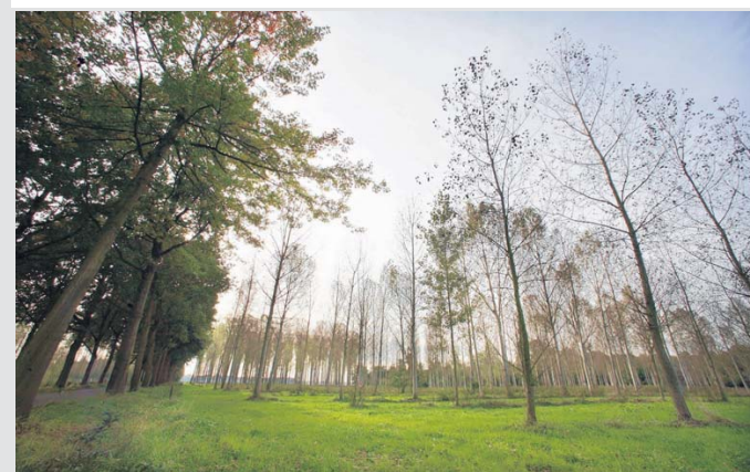
Het Limbrichterbos staat centraal in de visie van de acht belangenorganisaties.

zou de groene structuur langs de Ruitersdijk, Tomberstraat en Beelaertsstraat vanaf Illikhoven tot aan het Julianakanaal completeren.